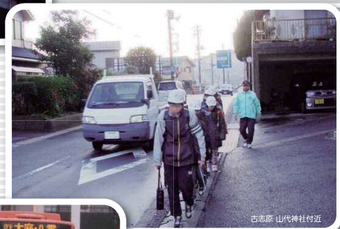
古志原 山代神社付近