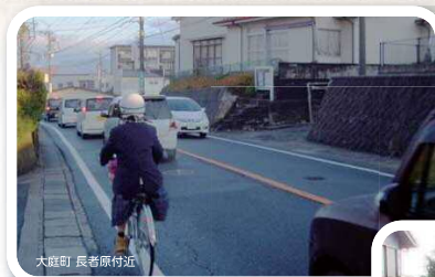
大庭町 長者原付近