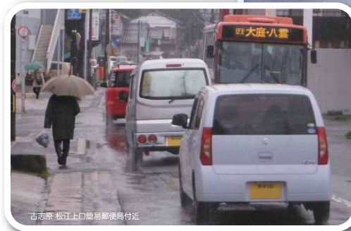
古志原 松江上口簡易郵便局付近