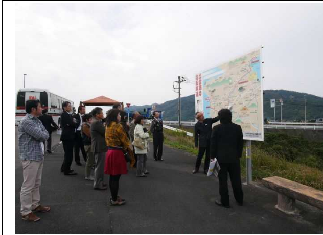
出雲神話風光スポット 西代橋視察