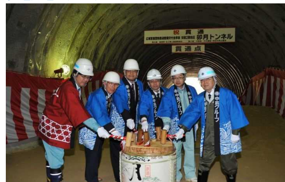
掛け声と共に鏡開き