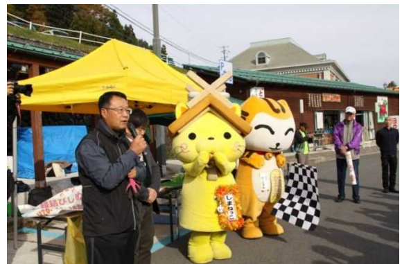
道の駅「赤来高原」での開会式