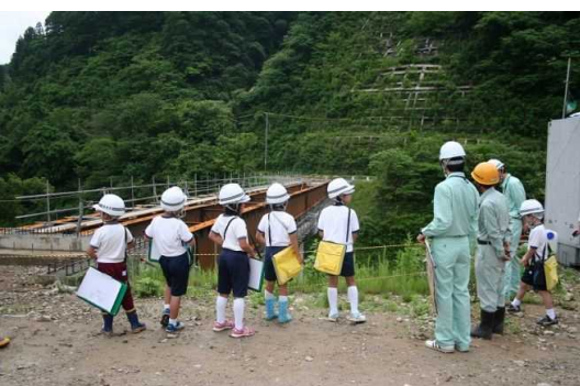
未完成の橋梁を間近で見学しました。