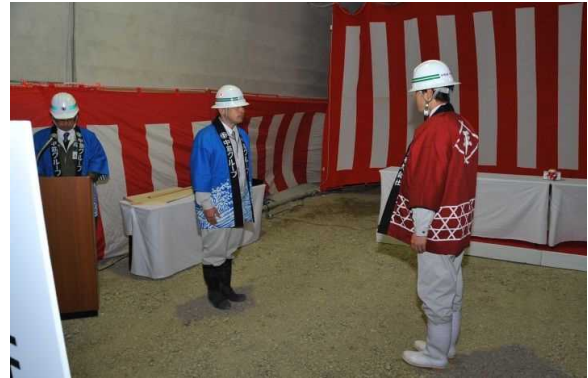
無事貫通したことを報告