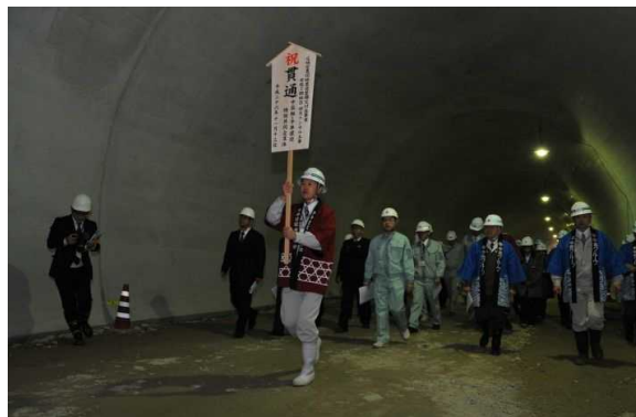
貫通点へ移動する参加者