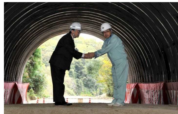
貫通点通り初め(松江県土整備事務所長と安来副市長)