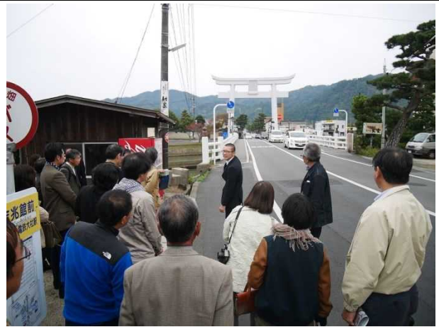
神門通り鳥居前 視察