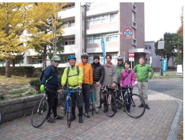
参加者9名(引率者含む)