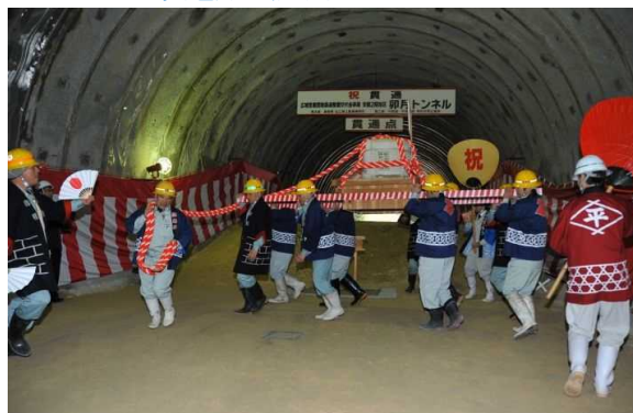
賑やかに樽御輿入場