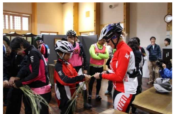
大しめ縄創作館でしめ縄づくり体験