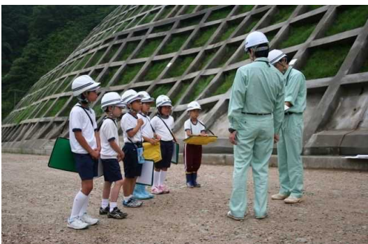
浜田県土整備事務所職員から道路の種類や林道の役割、工事の方法などの説明をしましたが、真剣に聞いてくれました。