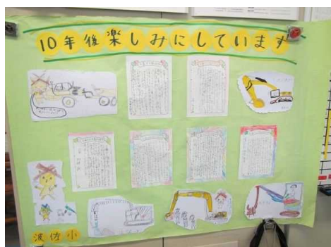
後日、生徒たちから絵と手紙のプレゼントが届きました。みんな10年後の路線完成を楽しみにしてくれています。ありがとうございました。