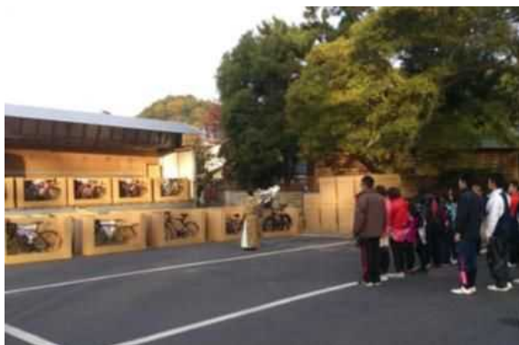
出雲大社で自転車の安全交通を祈禱