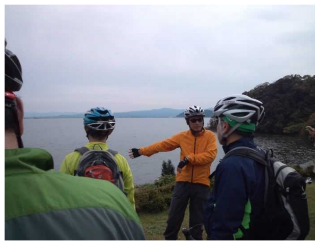
道の駅本庄にて中海周辺の風景について説明