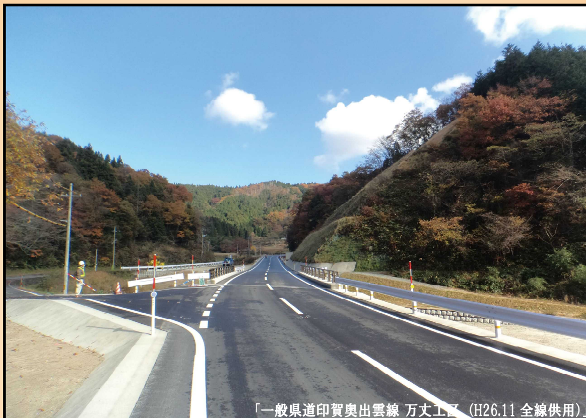
「一般県道印賀奥出雲線 万丈工区 (H26.11 全線供用)」