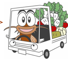
『しまねの農業農村整備すごろく』 キャラクター ドジョウのどうじょ君

11月13日（木）に安能広域農道で工事中の「卯月トンネル」の貫通式が行われたので、その様子を紹介しますよ～