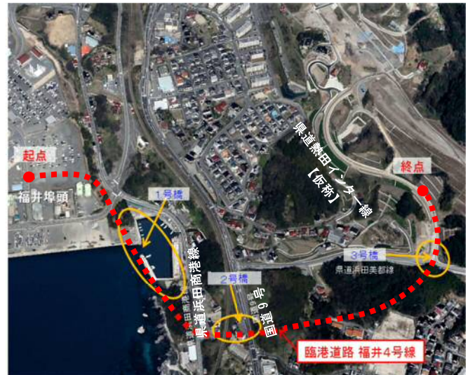
【上空から見た福井 4 号線建設予定地】