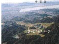
< ソフトビジネスパーク >