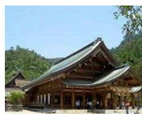
< 出雲大社 > 出雲道