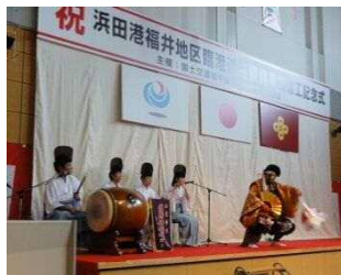
【着工式で披露される石見神楽（恵比寿）】