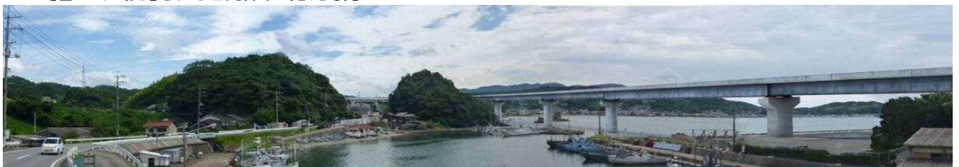
【県道浜田商港線からみた 1 号橋の完成予想】