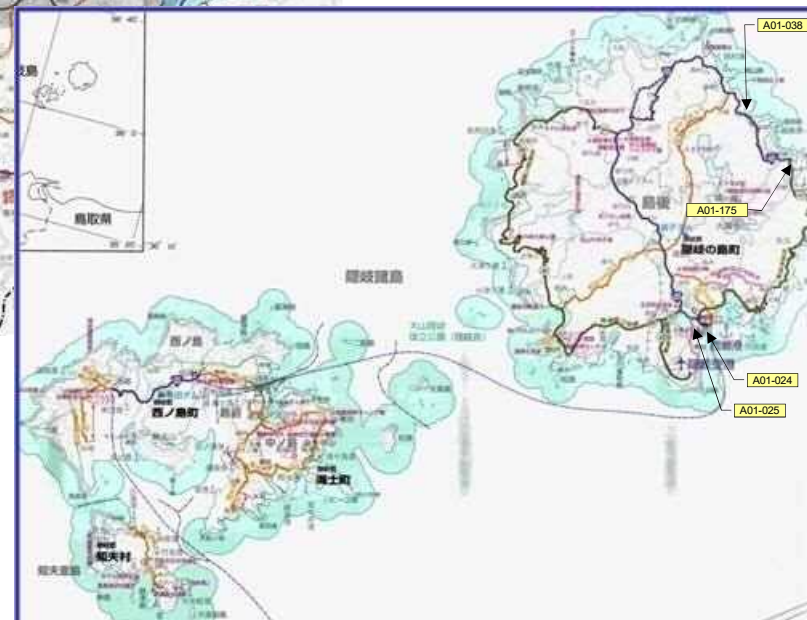
(参考図面 1/2) 社会資本総合整備計画(防災・安全交付金) 6 道路構造物の適確な維持管理の推進(防災・安全) (平成26年度～平成30年度) 島根県

【補足説明】 A事業のうち、次の事業については、付表を参照のこと ・橋梁修繕 ・トンネル修繕 ・シート・シルター修繕 ・大型カルバート修繕 ・橋梁点検 ・トンネル点検 ・シート・シルター点検 ・大型カルバート点検 ・門型標識等点検