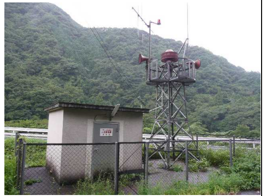
けいほうきょく 警報局