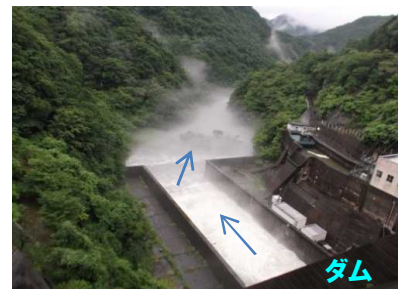
ダムからの放流状況 (7月7日)