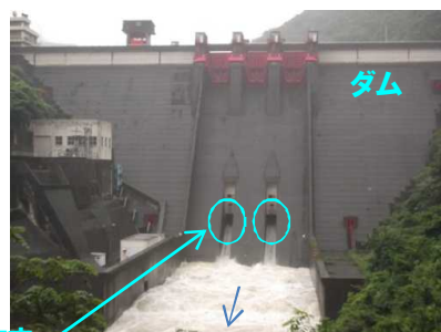
ダムからの放流状況 (7月7日)