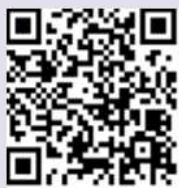
島根県水防情報 携帯用QRコード