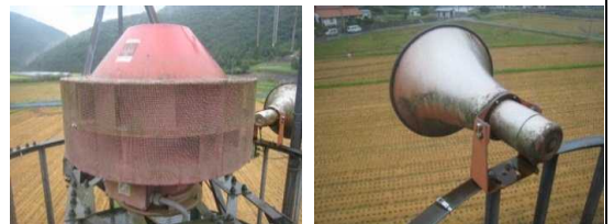
ふる 古くなったサイレン、スピーカー