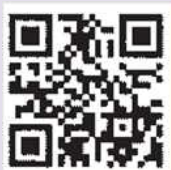
しまね防災メール 携帯用QRコード

■ 携帯やパソコンから登録すると、気象注警報や地震情報などの防災情報をメール配信してくれます。