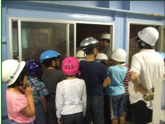
ていたいない しゅ ↑ダム堤体内（主ゲート）