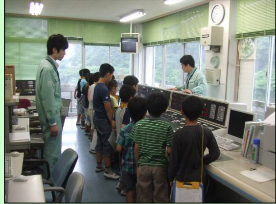
そうさしつ ↑操作室