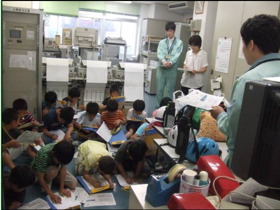
がいようせつめい ↑ダムの概要説明