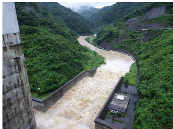
※7月5日大長見ダム直下流の様子

この洪水調整により、下流の中場水位局では、ダムがなかった場合に比べ91cmの水位低下ができたものと考えられます。