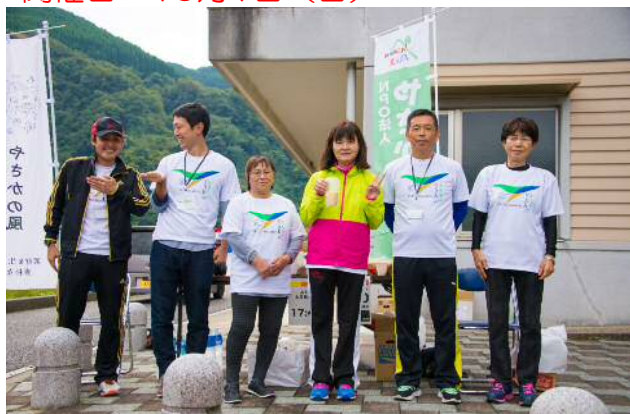
※大長見ダム給水所のボランティアのみなさん

○秘境奥島根やさかウルトラマラニックin浜田2017 100kmマラソンコースに大長見ダム周辺が含まれ、大会が開催されました。 開催日：10月1日（日）