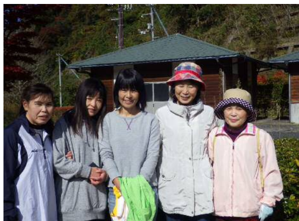
※ウォーキングに参加されたみなさん