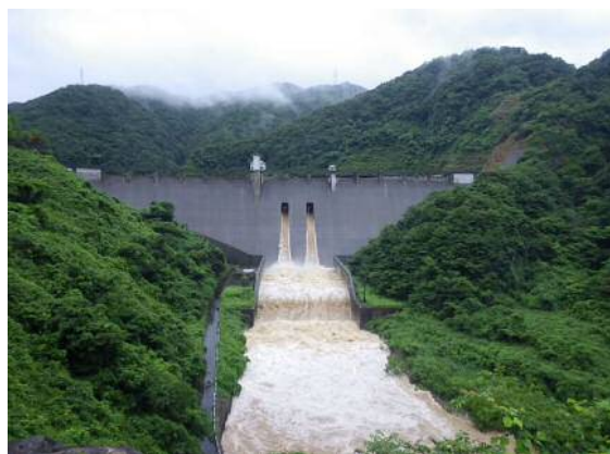
※7月5日大長見ダムからの放流状況

大長見ダムでも総雨量が319mmに達し、管理開始から過去最大となる流入量（ダムに入ってくる水の量）約596m 3 /sがあり、約500m 3 /sの流量をダムに貯めることで下流での流量を低減しました。これが ダムの洪水調節機能 と呼ばれるもので、今回はその機能を発揮することができました。