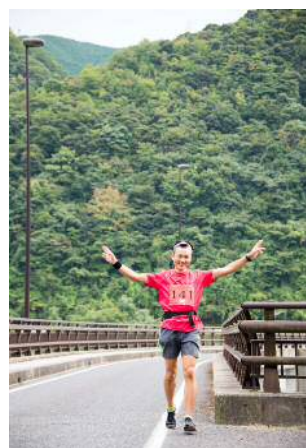
※大長見ダムを走る参加ランナー