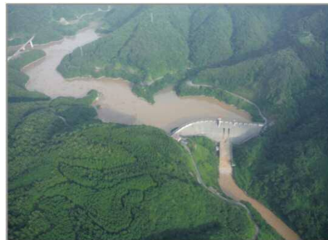
※7月5日当日の大長見ダム

5日早朝には浜田市で県内初となる「大雨特別警報」が発令されました。また、周布川では中場水位局で「氾濫危険水位」を超えたため、下流域で避難指示が発令されました。