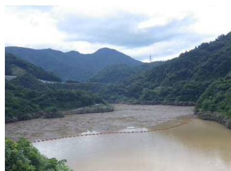
※大長見ダムに溜まった流木状況