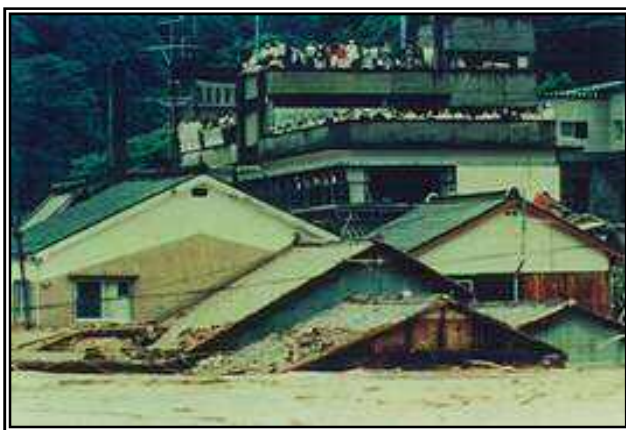
住民が避難した旧三隅町役場 （現：浜田市役所三隅支所）

6月2日には浜田市三隅町古市場の三隅中央公園で防災訓練（浜田市）が実施されましたが、これを糧に、今一度、避難場所の確認等、災害への備えをして下さい。