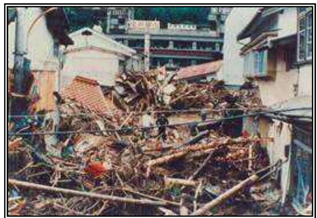
旧三隅町役場前に堆積した流木