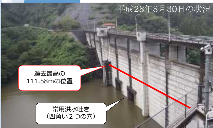
平成28年8月30日の状況

洪水警戒体制では、ダムごとに定められた気象条件を満たした場合、時間帯を問わずダム管理所に職員が詰めることとなります。