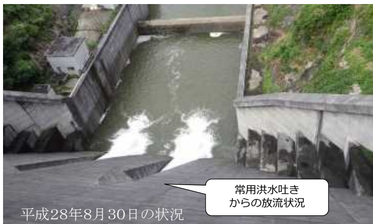
平成28年8月30日の状況

これまでの最高貯水位は、上の写真に表示している赤線のラインで、平成9年7月26日に記録した、111.58mです。（常時満水位98.6+12.98m）