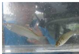
左：セスジボラ、右：ボラ