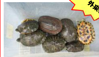
ミシシippアカミミガメ