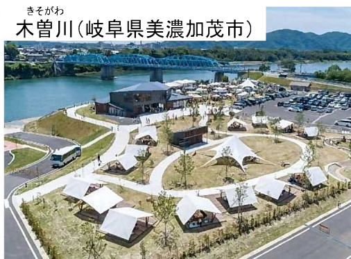
多様な民間事業者などと連携し、地域の交流拠点を創出した取組み