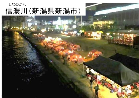
民間のアウトドアメーカーによるエリアマネジメントと連携した取組み