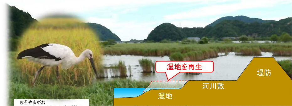
まるやまがわ 円山川(兵庫県)

多様な主体と連携しながら生態系ネットワークを形成する等、良好な自然環境の創出と観光振興、地域活性化にも貢献する取組等を推進。