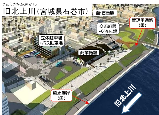
市街地と河川空間のつながりを高める整備イメージ

地域活性化に貢献する「まちと水辺が融合した良好な空間形成(かわまちづくり)」を推進。