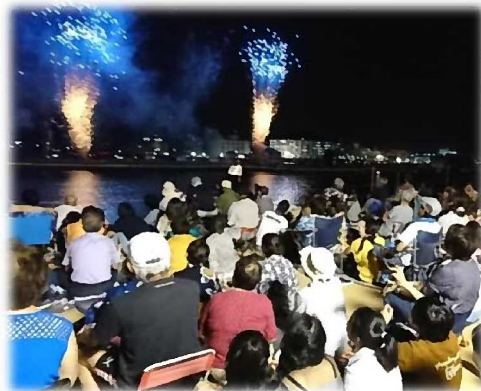
地域の賑わいを創出する取組