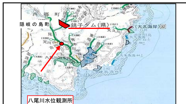
所在地：島根県隠岐郡隠岐の島町原田