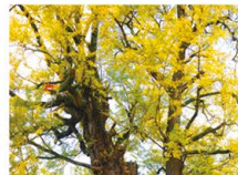
上有福の大イチョウ