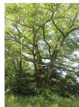
今田水神の大ケヤキ