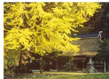
金言寺の大イチョウ