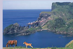
国賀海岸 (西ノ島町)

海面から257m垂直にそそり立つ「摩天崖(まてんがい)」や、波が作った岩の架け橋「通天橋(つうてんきょう)」など、西ノ島北西の延長7kmの海岸に隠岐を代表する奇勝が続く。海上、陸上どちらから見ても絶景である。