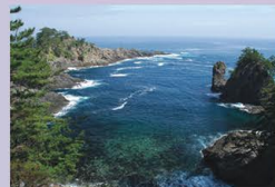
浄土ヶ浦海岸 (隠岐の島町)

海面から257m垂直にそそり立つ「摩天崖(まてんがい)」や、波が作った岩の架け橋「通天橋(つうてんきょう)」など、西ノ島北西の延長7kmの海岸に隠岐を代表する奇勝が続く。海上、陸上どちらから見ても絶景である。