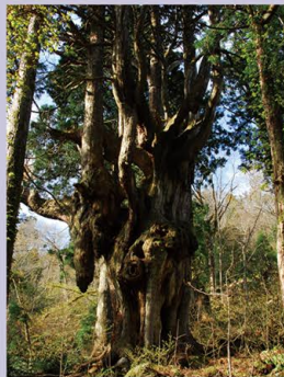
自然回帰の森 (隠岐の島町)

大満寺山とその北側の鷲ヶ峰(わしがみね)周辺は、樹齢300～400年の杉の天然林、オキシャクナゲ自生地ほか野生動植物の宝庫であり、登山道からは、屏風(びょうぶ)岩、トカゲ岩など奇岩の絶景が見られる。