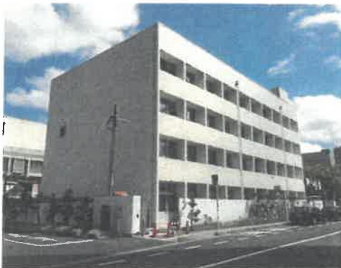
島根県東庁舎（松江市殿町 128 番地）