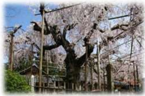
No. 4 千手院のしだれ桜

応募の際は、「島根県の巨樹・巨木」一覧に記載された「NO」と「愛称」を記載してください