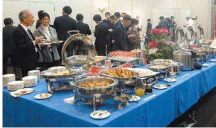
東部農林水産振興センター

URL https://www.pref.shimane.lg.jp/industry/norin/kikan/toubu_norin/ringyo/blog_cms/