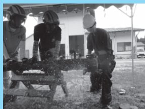
チェーンソーによる丸太伐り体験