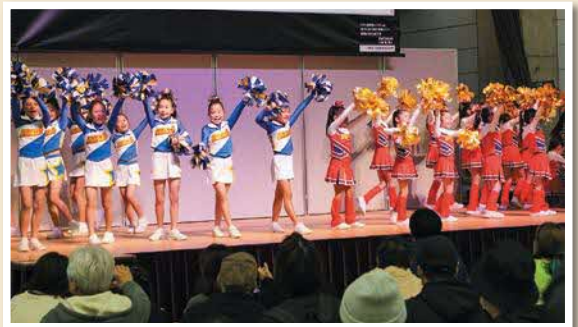
スパークルズによるチアリーディング