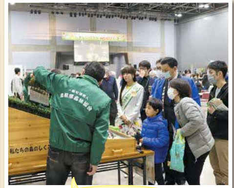
森のしくみを学習