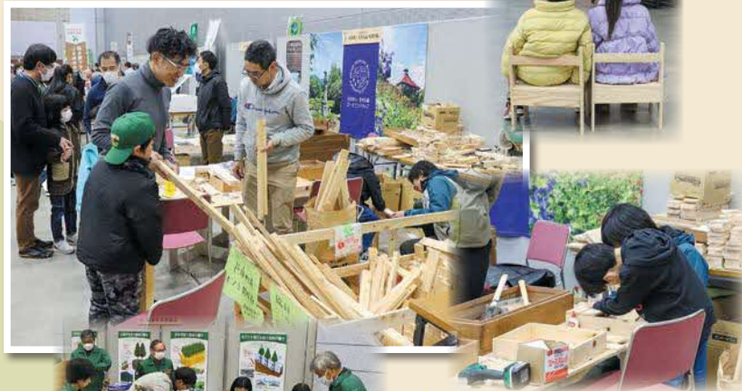
県産材を使った木工コーナーは子どもたちに大人気でした。