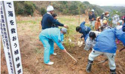
西部農林水産振興センター益田事務所

URL https://www.pref.shimane.lg.jp/industry/norin/kikan/seibu_norin/trend/topix.html