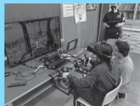
VRシミュレータによる 林業機械操作模擬体験