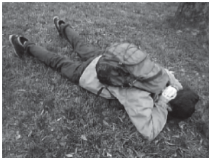
首、腹部、顔を守るために、 両手を首の後ろに回してうつぶせ