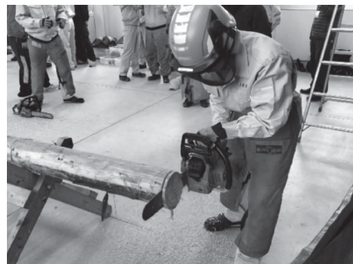
「体験学習」の様子 (チェーンソーによる丸太切り体験)