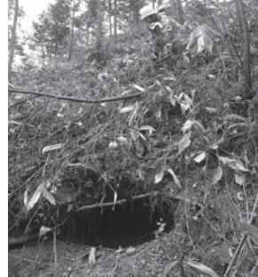
クマの冬眠穴 (急斜面型)