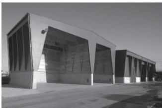
スサチツ工業株式会社 松江工場

笑顔が生まれる広場のような場所 施工場所：雲南市 設計者：宇田川孝浩建築設計事務所 施工者：(株)中澤建設