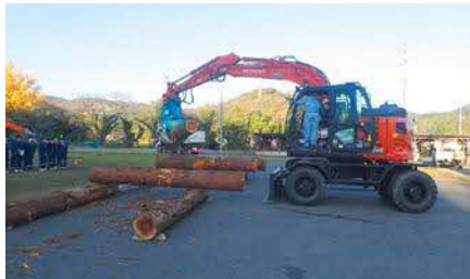
隠岐支庁農林水産局