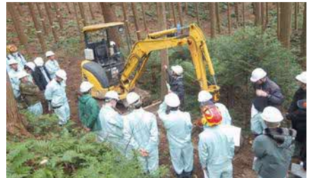
島根県立農林大学校