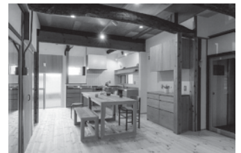
「ほほ笑み」たくさんの

笑顔が生まれる広場のような場所 施工場所：雲南市 設計者：宇田川孝浩建築設計事務所 施工者：(株)中澤建設