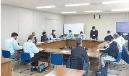
東部農林水産振興センター出雲事務所