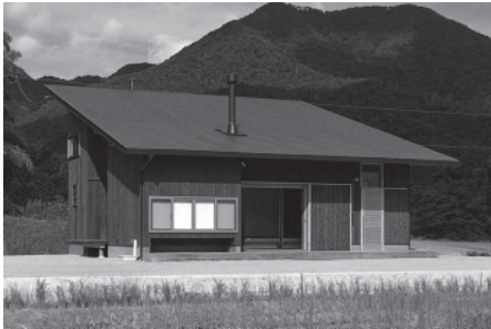
邑南町スローライフ