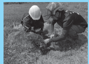
コンテナ苗植栽体験