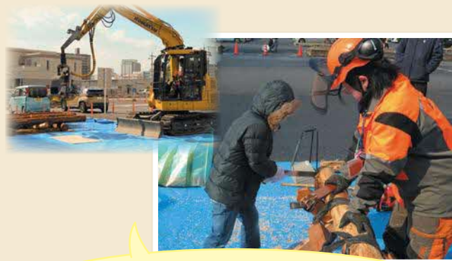
島根県立農林大学校による丸太切り体験と高性能林業機械の実演