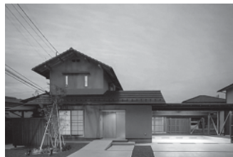
稲陽の家(おんようのいえ)