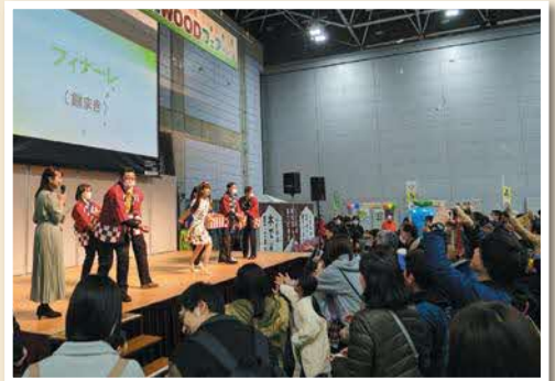
フィナーレ！餅まき