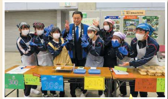
松江農林高校による豚汁、炊き込みご飯などの販売