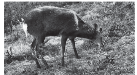
写真 ヒノキを食害するシカ

令和5年度に、県内の植栽から5年目までの人工林で50ヶ所、成木林で57ヶ所について調査を行いました。調査は作成したシカ影響度簡易チェックシートを用いて、造林木の被害状況やシカの痕跡に併せて被害レベルを記録し、市町ごとに被害レベルを図示しました（右下図）。