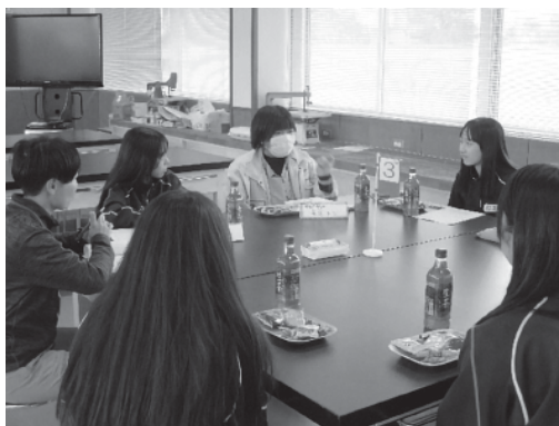
「意見交換会」の様子

県では、高校生を対象とした林業学習の取組を年々強化しているところであり、今後も「林業カフェ」などの取組を通じて多くの高校生に林業の魅力を伝え、林業への就業や農林大学校林業科への進学に繋げていきたいと考えています。