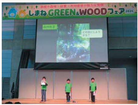
緑の少年団 活動発表