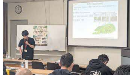
東部農林水産振興センター雲南事務所