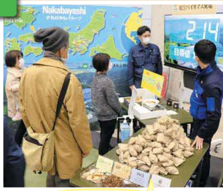
重さ当てゲームに挑戦