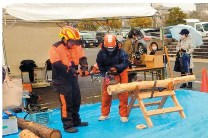
▲しまねGREEN&WOODフェア2024の様子