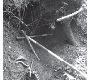
クマの冬眠穴 (根上がり型)