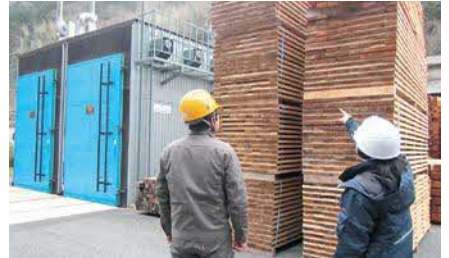
西部農林水産振興センター

URL https://www.pref.shimane.lg.jp/industry/norin/kikan/seibu_norin/trend/topix.html