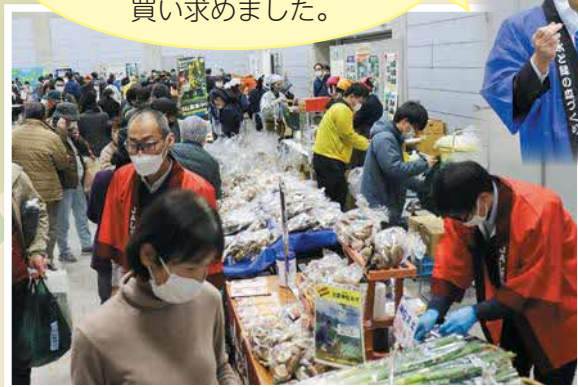
きのこ販売のブースでは椎茸や舞茸が販売され、多くのご来場者が買い求めました。