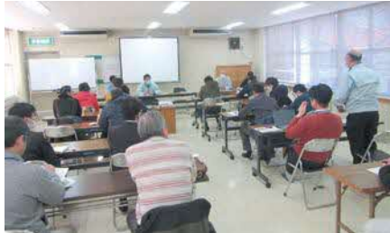
西部農林水産振興センター県央事務所