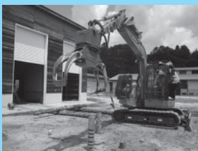
高性能林業機械の操作体験

チェーンソーや高性能林業機械、VRシミュレータなど 体験メニューが盛りだくさん!(^^)/<お楽しみに!>