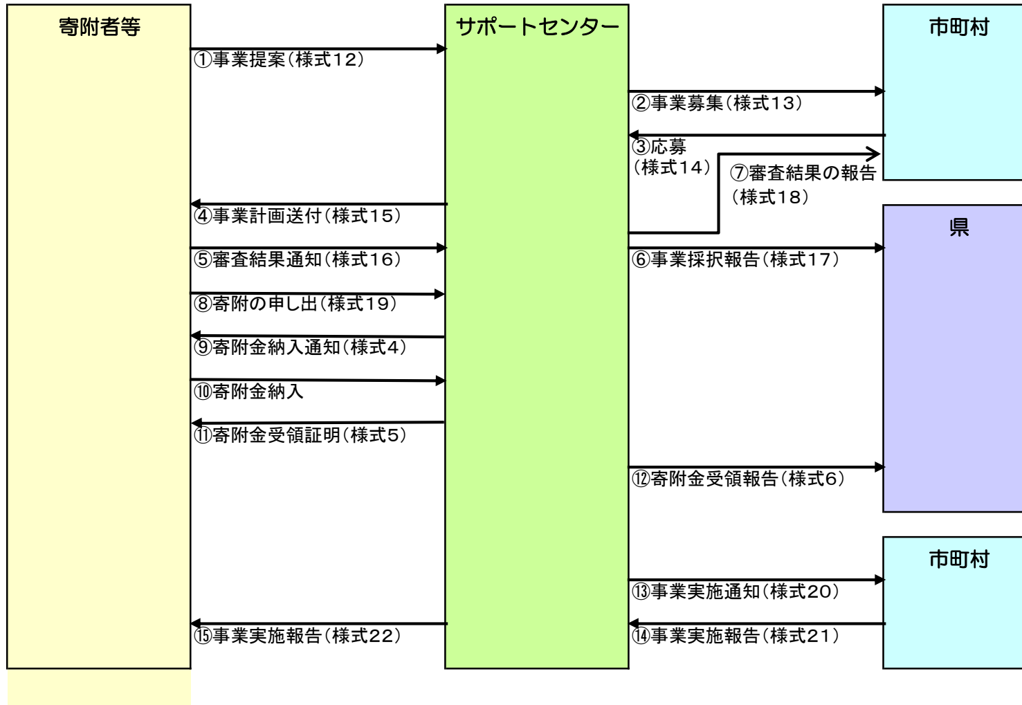
寄附者提案型のフロー図