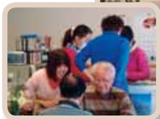
堀建設のみなさんと利用者のみなさん