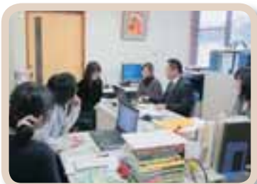
職場は和気あいあいとした雰囲気です。相談もしやすい。 (島根県西部発達障害者支援センターウインドのみなさん)

当法人の理念を表すものとして「5つの願い」がありますが、5つのうちの2つに「地域」というキーワードがあります。当法人の子育て支援は職員の子育て支援であるとともに地域の子育て支援にもつながると思います。