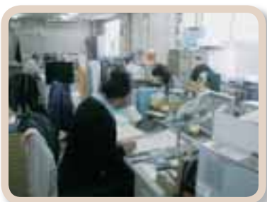
山陰温調工業のみなさん

そのためにも、現在も実施している個人面談を定着させ、従業員みんなが目的意識を持つことを徹底させようと考えています。人生における目的、自己実現、そのための会社貢献。会社存続の目的が個人の目的に影響を及ぼすことを認識し合った時、この支援制度というものが有効に動き出すものと考えています。