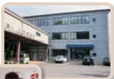
堀建設株式会社外観

案や失敗は「報・連・相」で、家庭内の悩み事は相談窓口にて社内意思疎通を図って行き、風通しの良い職場環境づくりを目指して行きたいと思っています。