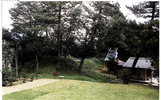
現在の平神社古墳の全景