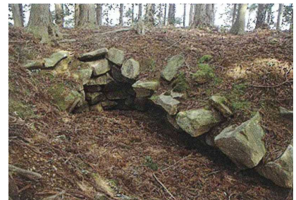
平神社古墳の石室