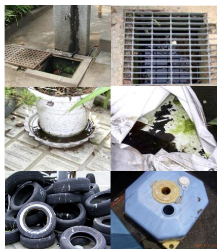
図3 幼虫の典型的な発生源

ヒトスジシマカの幼虫は比較的小さい容器に発生する。住宅地では雨水マス、植木鉢やプランターの水の受け皿、庭先に置き忘れたバケツや壺、コンビニ弁当などのプラスチック容器、古タイヤなどが発生源となる。また、雨を除けるために被せたビニールシートの窪みや、隙間にたまった水、廃棄された機械のフレームにたまった水などにも幼虫が発生する(図3)。一般にヤブカ属の卵は乾燥に強く、ヒトスジシマカの卵は数ヶ月の乾燥に遭遇しても、いったん水に浸ると孵化してくる。