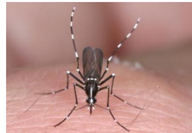
図 1 ヒトスジシマカの成虫

前述のように、デングウイルスとチクングニアウイルスは、主にネッタイシマカとヒトスジシマカによって媒介される。ネッタイシマカは、かつては沖縄や小笠原諸島に生息し、熊本県牛深町では 1944～1947年に一時的に生息したことが記録されている。当時のデング熱の国内流行にネッタイシマカが関与した可能性が示唆されたが、1955年以降は国内での採集記録がない。現在、ネッタイシマカは国内には生息していないと考えられているが、近年、国際空港のターミナルビル周辺や貨物便の機内で発見される事例が相次いでいる。