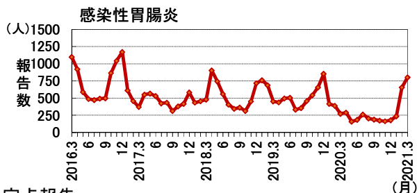
過去5年間の発生推移(2016年3月～2021年3月：月4週で換算)