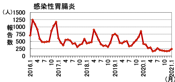
過去5年間の発生推移(2016年1月～2021年1月:月4週で換算)