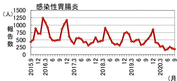
過去5年間の発生推移(2015年9月～2020年9月：月4週で換算)