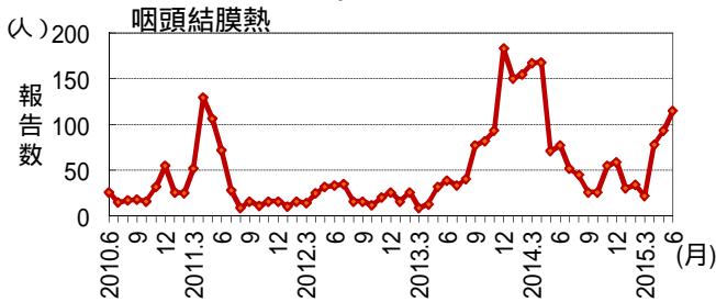
過去5年間の発生推移 (2010年6月～2015年6月 : 月4週で換算)