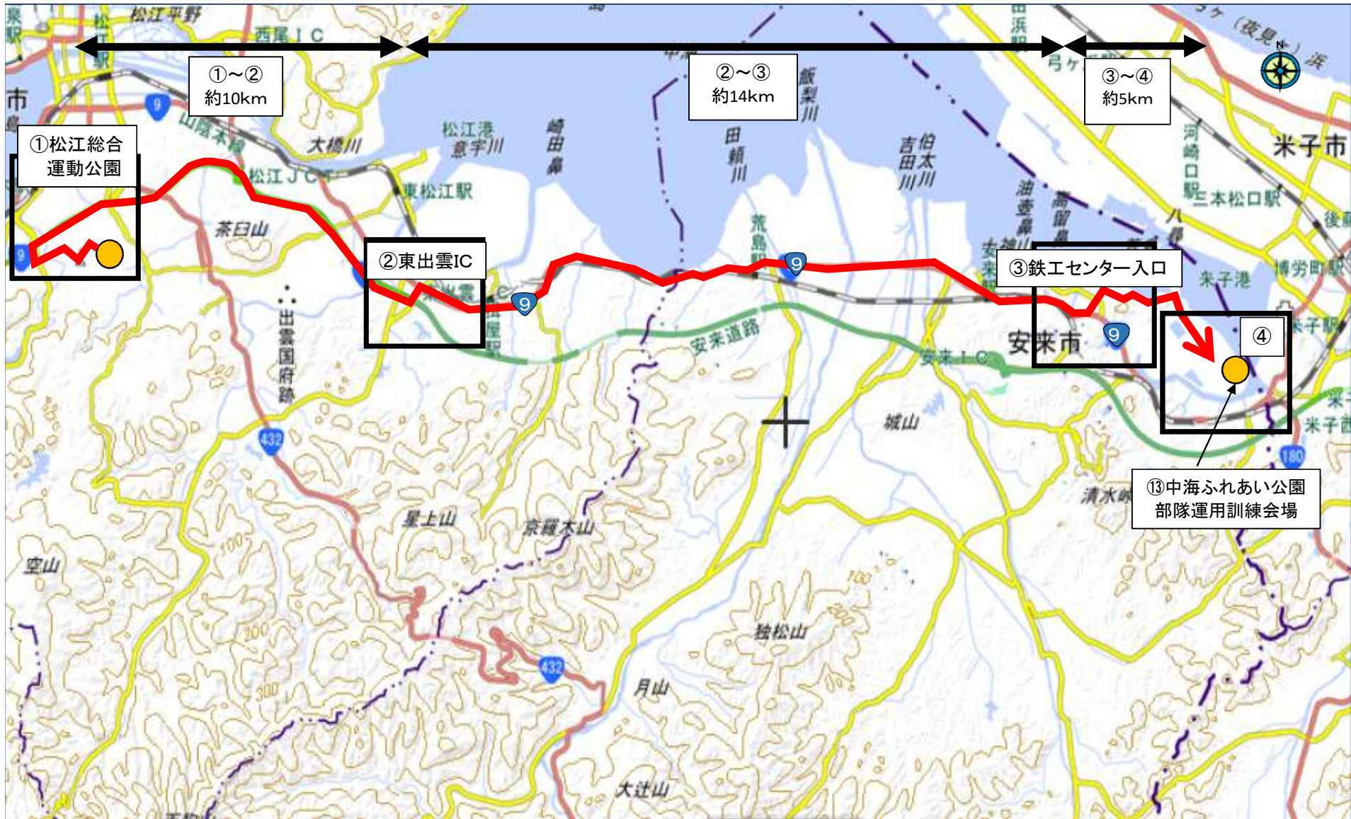
部隊移動経路図(全体図)