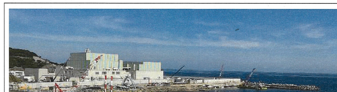
敷地東側からの全景