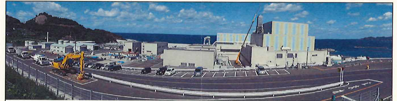
敷地南側からの全景