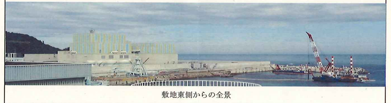
敷地東側からの全景