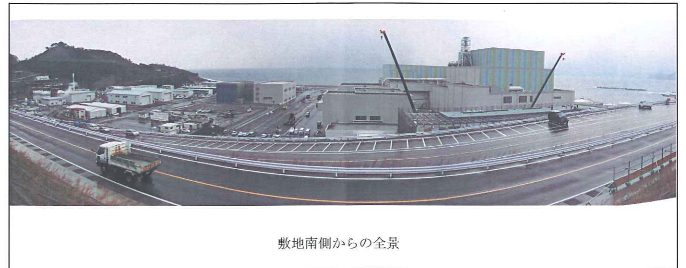
敷地南側からの全景