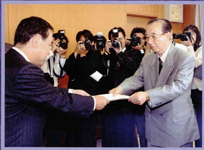
中国電力(株)山下社長に回答書を手渡す澄田知事 (平成 18 年 10 月 23 日)