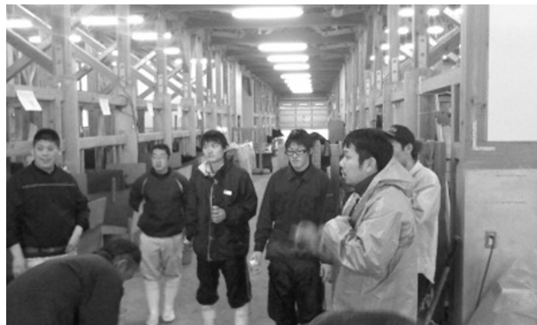
写真1 ミーティングの様子

牛舎の清掃、飼養管理はGyu・牛会員による2人1組の当番制で行うことで、特定の会員に作業が集中しないように配慮し、個人の負担を軽減した。