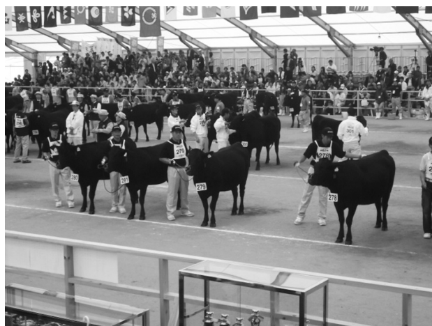
写真4 全共出品の様子

審査会場では、他県の出品者と比較してGyu・牛会員の若さが目立っており、調教技術の高さは他県の関係者からも高く評価され、島根県の若い力と技術力の高さを全国にアピールでき、高齢化が進む島根県の畜産業において若い担い手が育っていることを印象づけた（写真4）。