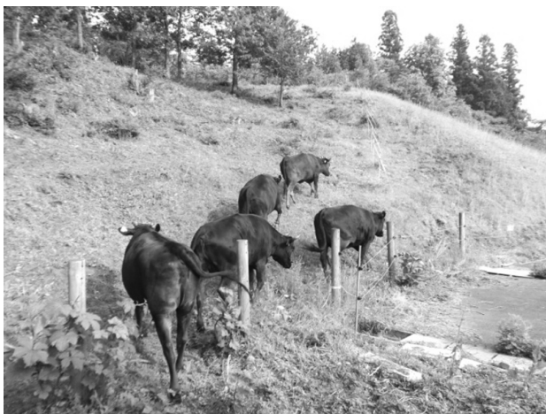
写真2 昼夜放牧中の候補牛

審査時に理想的な姿勢に保つための重要な技術である。調教は牛の担当者が行い、調教アドバイザーによる定期的な指導のほか、7月の県代表選出後は各担当者が毎日1時間以上調教練習を継続して実施した（写真3）。