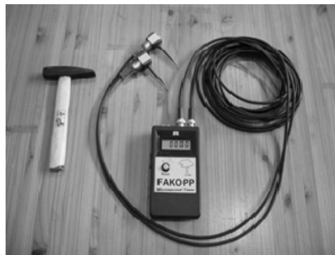
写真1 応力波伝播速度測定機ファコップ