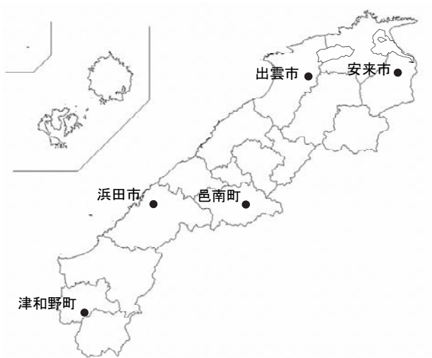
図1 水気耕苗の植栽試験地

島根県内の森林組合が栽培したもののうち、本県の苗木規格に適合した2～3年生の苗木が選抜され、水気耕苗とほぼ同じ大きさの普通苗とともに植栽された。