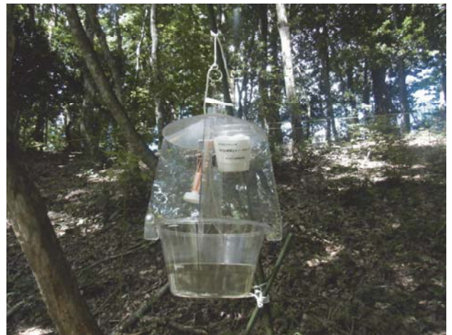
写真 4 捕虫トラップ試験