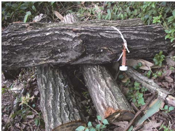
写真 3 集合フェロモン剤を設置したおとり丸太