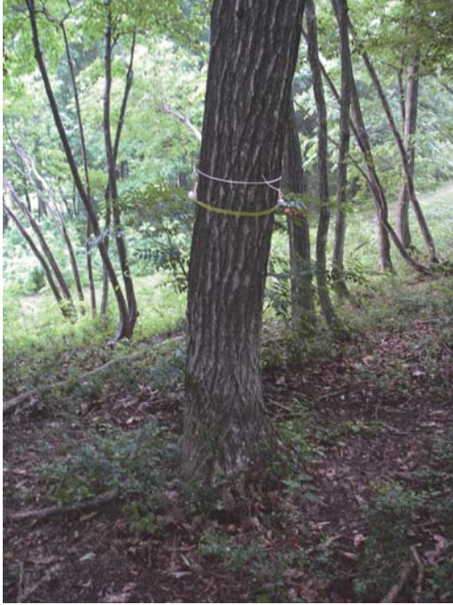
写真 1 集合フェロモン剤を設置したおとり木

周藤成次・富川康之・扇大輔 (2001) 島根県におけるコナラの集団枯死被害とカシノナガキクイムシの寄生・脱出. 島根林技研報 52:1-10.