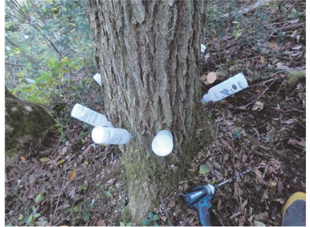
写真 2 殺菌剤の樹幹注入