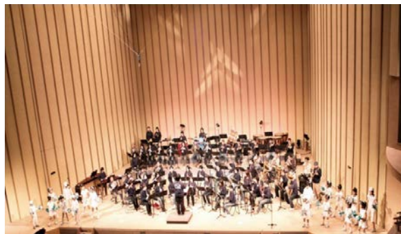
<地元楽団と子どもたちの公演の様子（H13）>