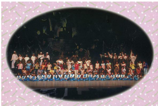
<住民参加型ミュージカルの様子（H13）>

これらの流れをいかに活用して、幅広い年齢層の人々を巻き込み繋がりを強めて行けるか。さらに、そうして強めた地域コミュニティを軸にした町外からの人材交流を深め新たなつながりを派生させる事が出来るかが大きな課題の1つとなっている。