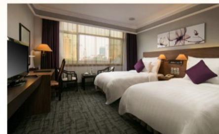
レイクサイドホテルハノイ