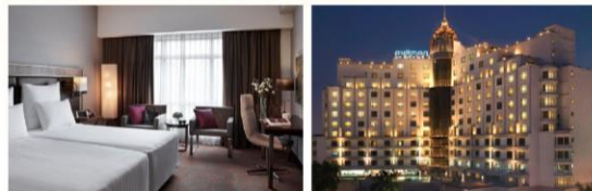
ハノイ プルマンハノイホテル