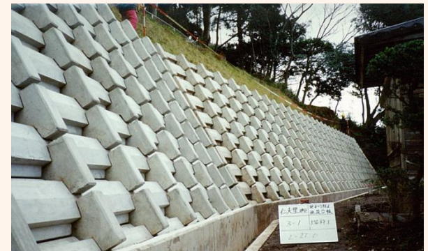
[知夫村:仁夫里地区]