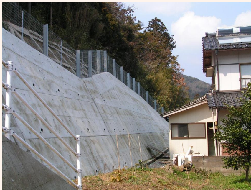
[西ノ島町:大山地区]