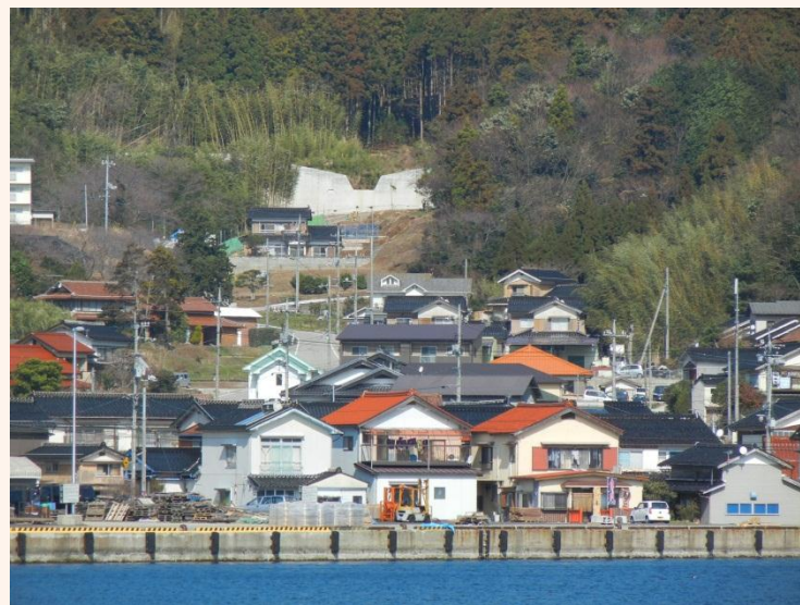
[西ノ島町:尾の代川]