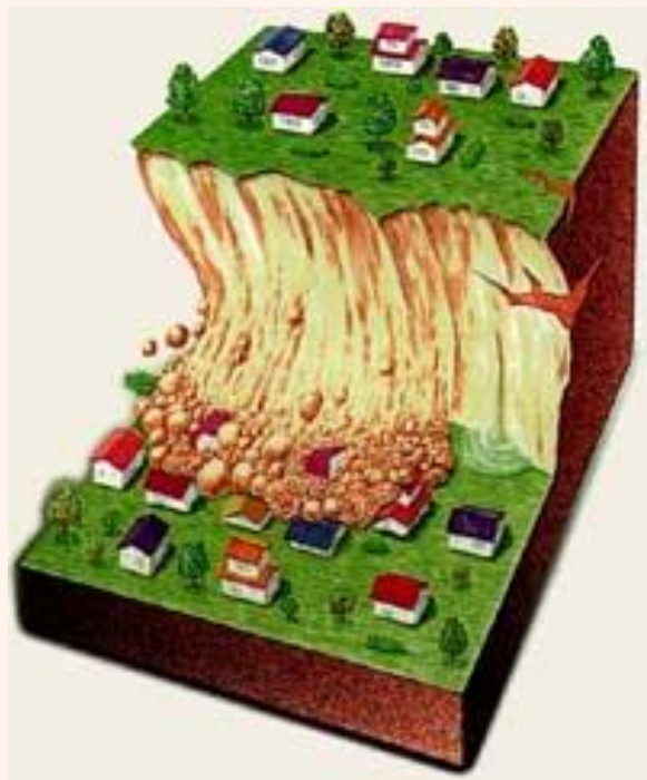
[国土交通省HP:砂防の役割と対策]

がけ崩れとは、地中にしみ込んだ水分が土の抵抗力を弱め、雨や地震などの影響によって急激に斜面が崩れ落ちる現象のことをいいます。がけ崩れは、突然起きるため、人家の近くで発生すると逃げ遅れる人も多く人的被害の割合も高くなっています。