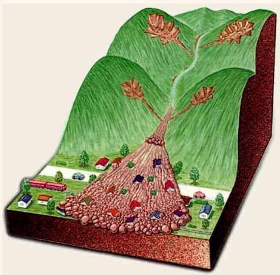
[国土交通省HP:砂防の役割と対策]

土石流とは、山腹、川底の石や土砂が長雨や集中豪雨などによって一気に下流へと押し流されるものをいいます。その流れの速さは規模によって異なりますが、時速20~40kmという速度で一瞬のうちに人家や畑などを壊滅させてしまいます。