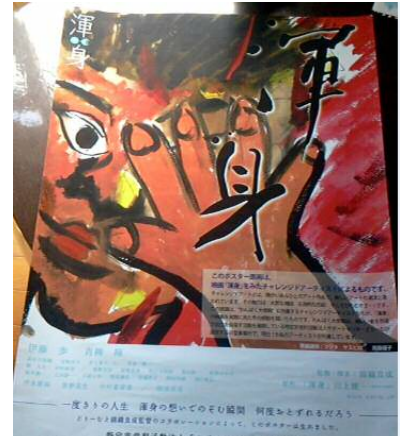
映画 渾身のポスターに採用されました。