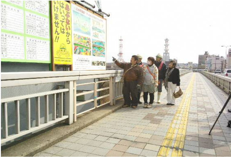
街とアートで飾る活動(アートタウンプロジェクト)が始まりました。 第一号はくにびき大橋の工事現場(カナツ技建工業(株)さん)の看板アートを描きました。